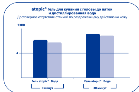
Рис.2. Уровень эритемы (покраснения) in vivo после 30 минутной аппликации «Atopic® Гель для купания с головы до пяток» в сравнении с дистиллированной водой.

Рис.1. Уровень трансэпидермальной потери воды (ТЭПВ) in vivo после 30 минутной аппликации «Atopic® Гель для купания с головы до пяток» в сравнении с дистиллированной водой.